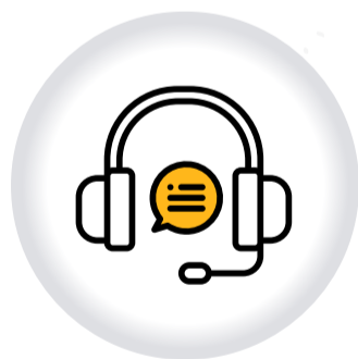
Recepción y trámite QUEJAS Y SOLUCIONES