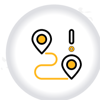
Ruta por la RECONCILIACIÓN