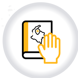
Juramento COLOMBIANO POR ADOPCIÓN