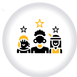
Portal Étnico de ATENCIÓN