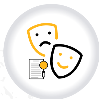
Juegos CONCURSOS Y ESPECTÁCULOS