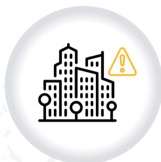
Infracciones al RÉGIMEN DE OBRAS Y URBANISMO