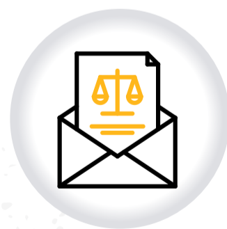
Citaciones NOTIFICACIONES AUDIENCIAS PÚBLICAS