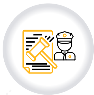
Registro RECURSO DE APELACIÓN COMPARENDOS CNSCC