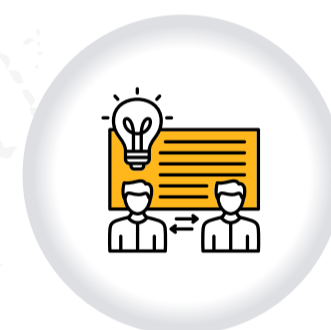
Ruta atención distrital CONTRA LA TRATA DE PERSONAS