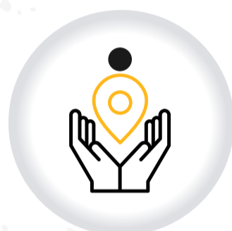
Plataforma INTERRELIGIOSA PIRPAS