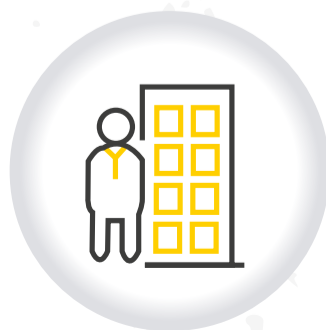
Consulta Registro ÚNICO DE ADMINISTRADORES RUA