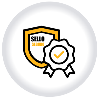
Certifica TU BAR