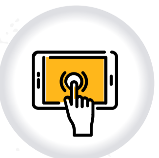
Ventanilla Virtual de RADICACIÓN CORRESPONDENCIA