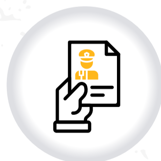
Registro OBJECIONES A COMPARENDOS CNSCC