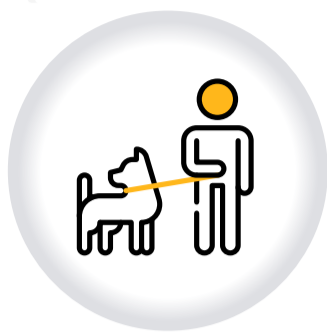
Registro EJEMPLARES CANINOS DE MANEJO ESPECIAL