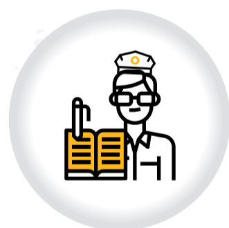
Ruta de atención ABUSO AUTORIDAD