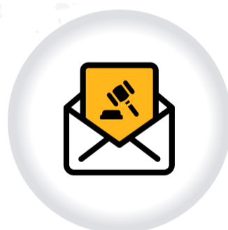
Notificaciones ACTUACIONES DISCIPLINARIAS