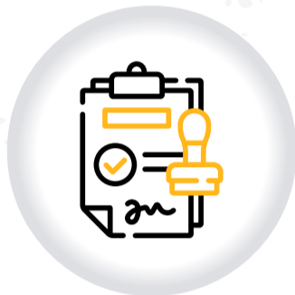
Solicitud de CONCEPTO PARA JUEGOS