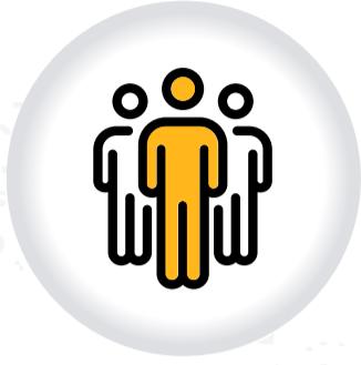
Marchas MANIFESTACIONES Y CONCENTRACIONES