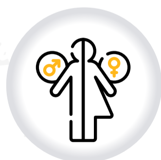
Ruta distrital de ATENCIÓN A VÍCTIMAS DE VIOLENCIA POR IDENTIDAD DE GÉNERO