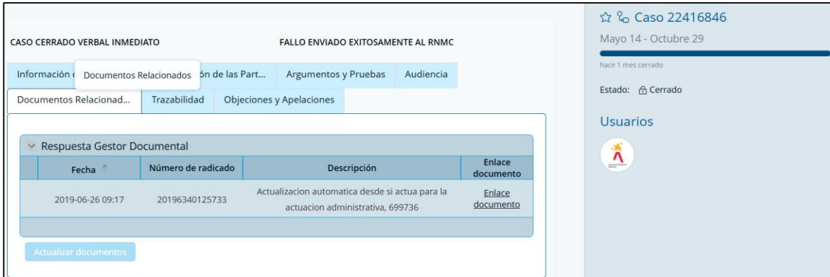
Fuente: Capturas del sistema ARCO que evidencia estado abierto del expediente en el sistema (Imagen 1 – Fuente: Consulta ARCO, 08/12/2025)

De igual forma se realiza la verificación del estado del expediente en el aplicativo RNMC encontrándose en estado cerrado.