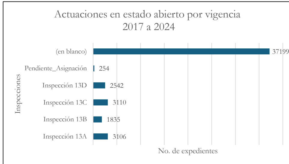
Grafica No. 2