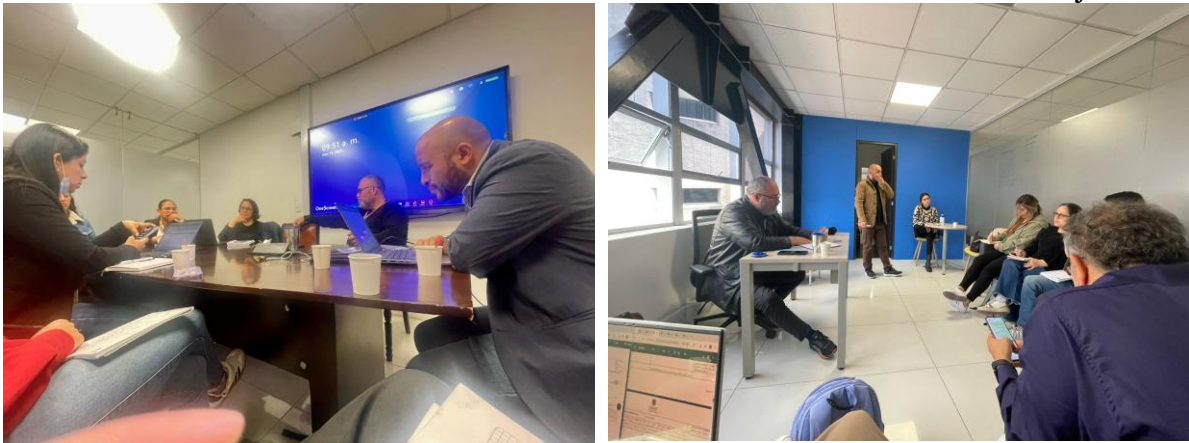
Ilustración 6. Reuniones mesa PRUNNA Reclutamiento e instrumentalización de NNAJ

La primera con la Defensoría del Pueblo, la Consejería de Paz Víctimas y Reconciliación, secretaria de Integración Social, secretaria de Seguridad, en un proceso de documentación y la construcción de un cronograma de acciones y mapeo de riesgos, frente al uso, utilización, reclutamiento y vinculación de NNAJ a grupos organizados. El objetivo del observatorio es poder sistematizar la información recolectada y generar una cartografía que permita generar mapas de calor y focalizar los puntos más álgidos en la ciudad donde se presentan estos fenómenos.