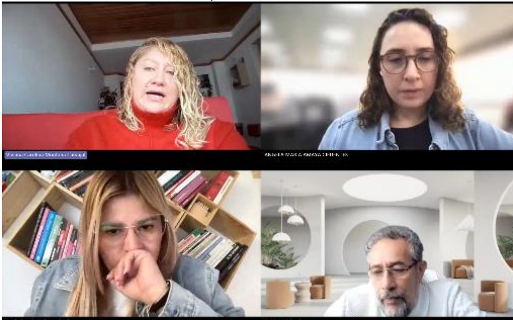
Ilustración 7. Mesa técnica, sistema distrital de formaciones en DDHH