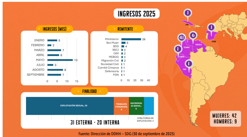
Imagen 2. Ingresos a la Ruta de trata de personas

En la tabla se presentan los ingresos registrados durante el año 2025, con un total de cincuenta y un (51) casos. De estos, veintinueve (29) fueron remitidos por el Ministerio del Interior y seis (6) por la Secretaría de la Mujer. La finalidad predominante corresponde a explotación sexual, con treinta y cinco (35) personas, seguida de trabajos y servicios forzados con seis (6) casos y matrimonio servil también con seis (6) personas. En cuanto a la modalidad, treinta y un (31) casos corresponden a modalidad externa y veinte (20) a modalidad interna. Respecto al sexo, se registran cuarenta y dos (42) mujeres y nueve (9) hombres.