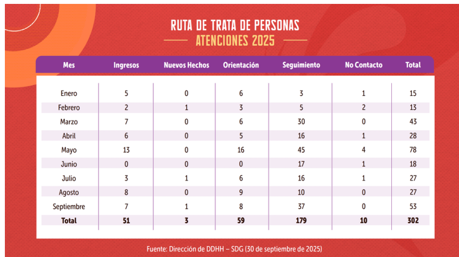
Imagen 1. Cifras de atención – Ruta de trata de personas

En la tabla se presentan los ingresos registrados durante el año 2025, con un total de cincuenta y un (51) casos. De estos, veintinueve (29) fueron remitidos por el Ministerio del Interior y seis (6) por la Secretaría de la Mujer. La finalidad predominante corresponde a explotación sexual, con treinta y cinco (35) personas, seguida de trabajos y servicios forzados con seis (6) casos y matrimonio servil también con seis (6) personas. En cuanto a la modalidad, treinta y un (31) casos corresponden a modalidad externa y veinte (20) a modalidad interna. Respecto al sexo, se registran cuarenta y dos (42) mujeres y nueve (9) hombres.