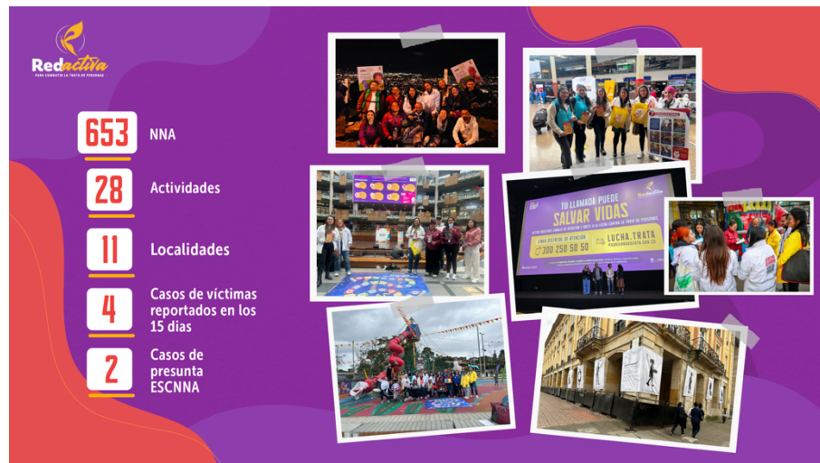
Imagen 4. Resultados conmemoración 15 días de memoria y prevención contra el delito de trata de personas en Bogotá

Durante las semanas de conmemoración de la lucha contra la trata de personas se realizaron acciones de sensibilización que alcanzaron a 5.337 personas en diferentes localidades y sectores de Bogotá. Entre las actividades desarrolladas se destacan: el lanzamiento del programa de prevención en el Aeropuerto El Dorado; jornadas de empleabilidad y prevención en espacios públicos (centros comerciales, escaleras y senderos ecológicos); feria institucional de prevención del trabajo infantil; cine-foros y actividades culturales; así como sesiones informativas virtuales dirigidas a padres y cuidadores, en articulación con la Secretaría de Educación, entre otras.