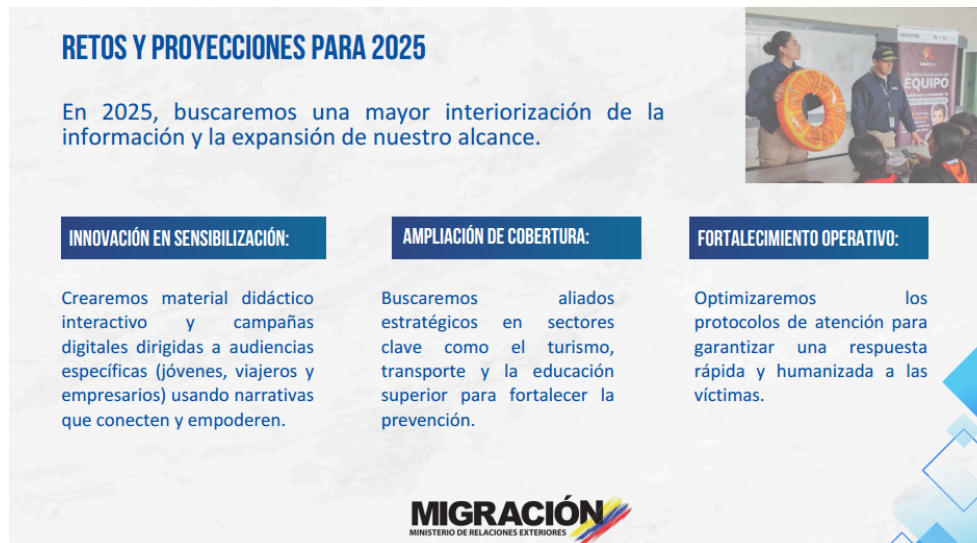
Imagen 3. Presentación Migración Colombia Regional Andina

Así mismo, se socializaron las principales fuentes de articulación institucional que se consideran estratégicas para potenciar el impacto de las acciones frente a la trata de personas. En este sentido, se plantea la necesidad de fortalecer el trabajo conjunto con la Secretaría Distrital de Seguridad, Convivencia y Justicia, con el fin de consolidar un frente articulado para los operativos de verificación, vigilancia y control en zonas identificadas como de alto riesgo. La propuesta busca avanzar en la creación de protocolos de acción conjunta, donde los roles y responsabilidades de cada institución estén claramente definidos, lo que permitiría una respuesta más rápida, coordinada y eficaz frente a los escenarios de riesgo.