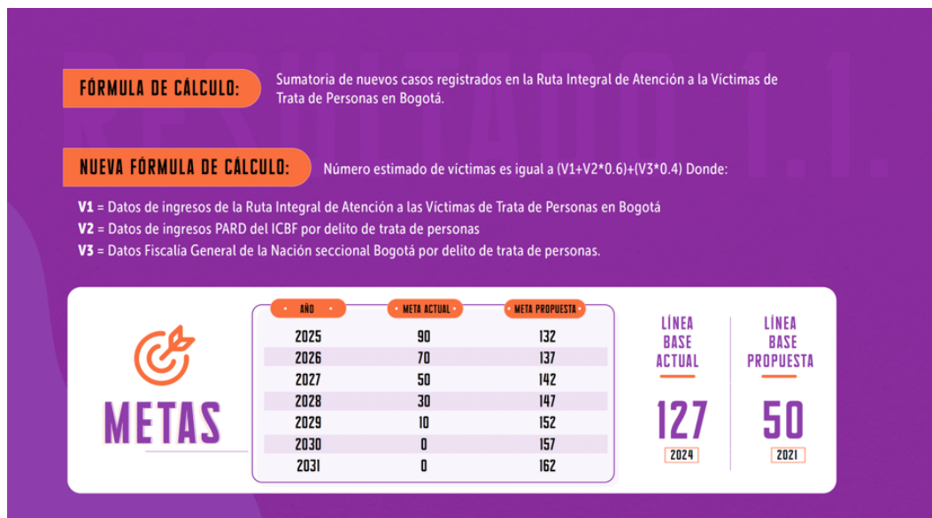
Imagen 2. Modificaciones Política Pública – Resultado 1.1. (2)