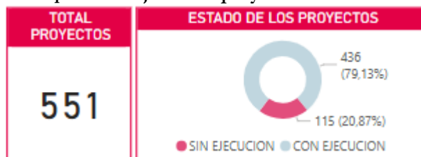
Gráfica 4. Avance de cumplimiento ejecución proyectos de inversión PDL vigencia 2024