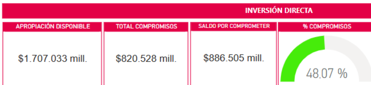
Gráfica 5. Nivel de cumplimiento ejecución presupuestal proyectos PDL vigencia 2024