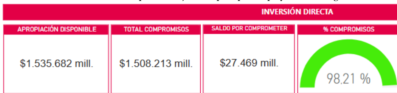
Gráfica 3. Nivel de cumplimiento ejecución presupuestal proyectos PDL vigencia 2023