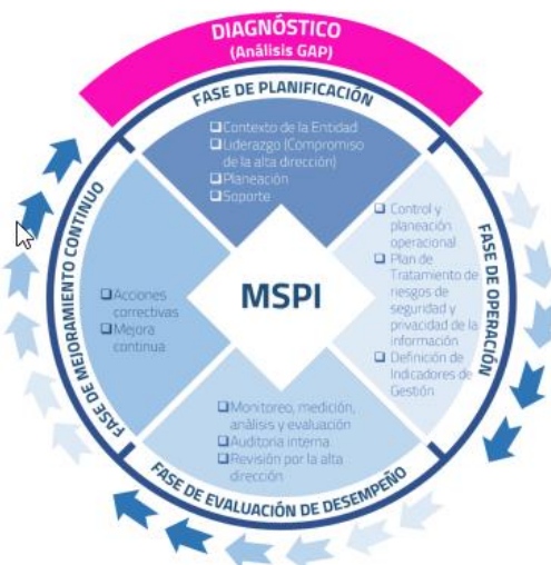
Ilustración 3 Ciclo del Modelo de Seguridad y Privacidad de la Información

A continuación, se presentan las fases de implementación del Modelo de Seguridad y Privacidad de la información para la Secretaría Distrital de Gobierno de Bogotá,