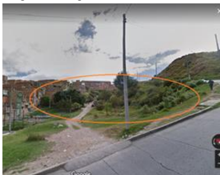
Carrera 10 B No. 41 – 51 Sur

Registro fotográfico Zona Verde barrio Lomas Segundo sector