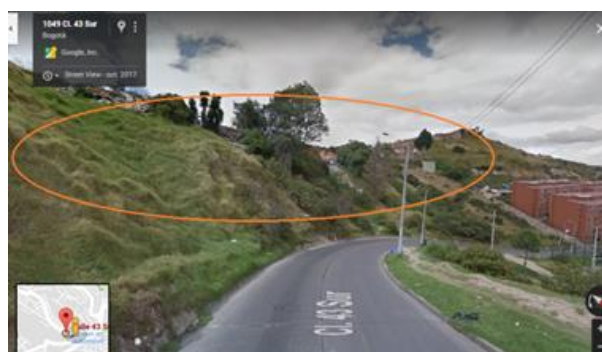
Calle 43 Sur entre Carrera 10 y 11