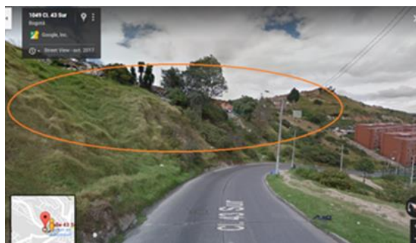
Calle 43 Sur entre Carrera 10 y 11

De igual manera le solicito nos informe las acciones realizadas lo anterior de conformidad con el Art. 21 de la Ley 1755 de 2015 y se dé respuesta de esta solicitud al peticionario al correo electrónico jarc-80@hotmail.com .