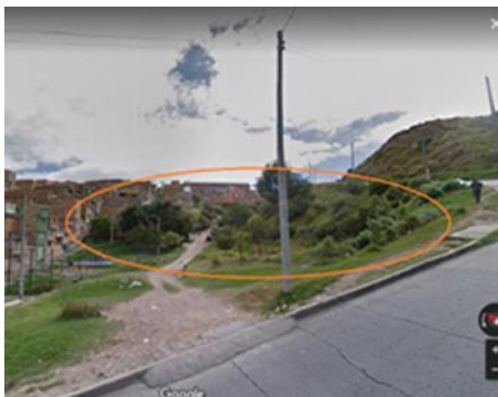
Carrera 10 B No. 41 – 51 Sur

En este contexto cordialmente solicito de acuerdo con las competencias de la institución la realización de acciones a las que haya lugar en el sector: zonas verdes del barrio Lomas Segundo sector dirección de Referencia Entorno Carrera 10 B No. 41 – 51 Sur y Calle 43 Sur entre Carrera 10 y 11.