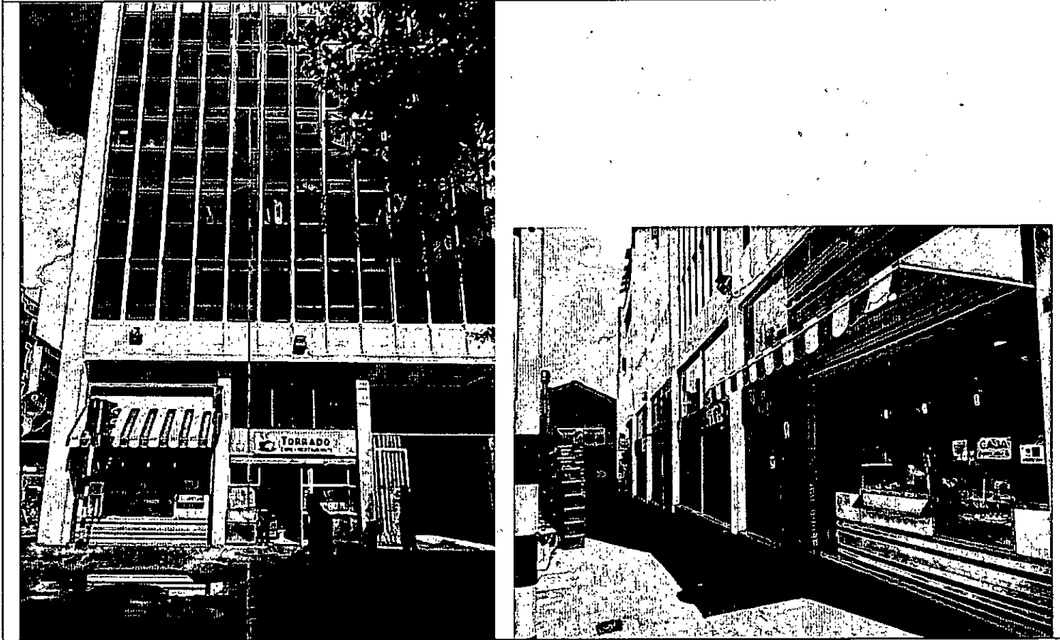
IMAGEN 2: VISTA CITACION