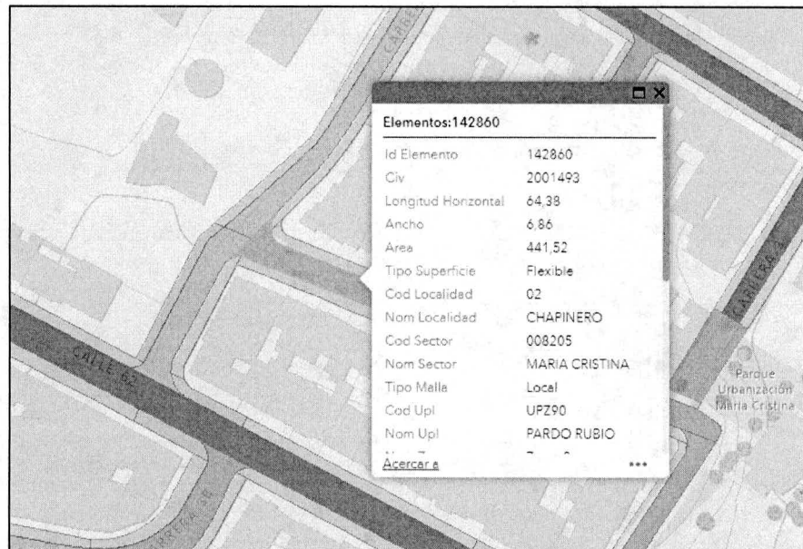
Pantallazo SIGMA