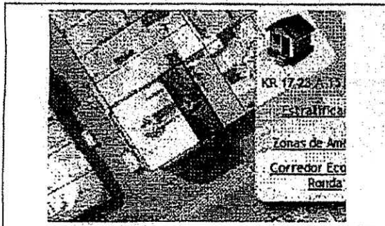
Localización del predio